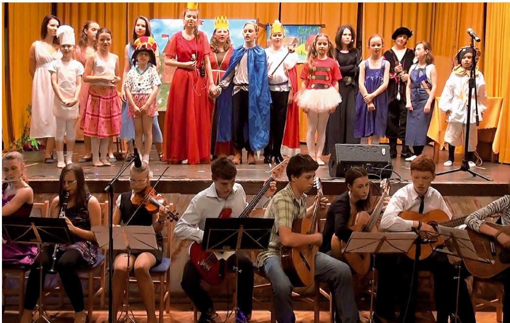
Závěrečný žákovský koncert 6. 6. 2013 v sále Dělnického domu – představení Šípková Růženka