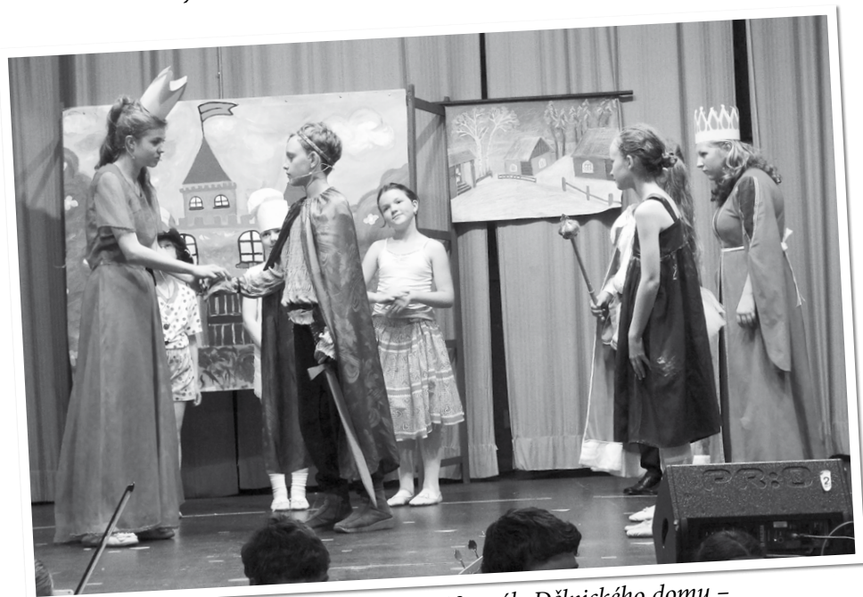
Závěrečný žákovský koncert 6. 6. 2013 v sále Dělnického domu – představení Šípková Růženka