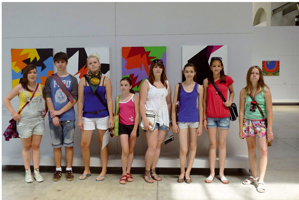
Exkurze žáků výtvarného oboru ZUŠ na výstavě v Brně