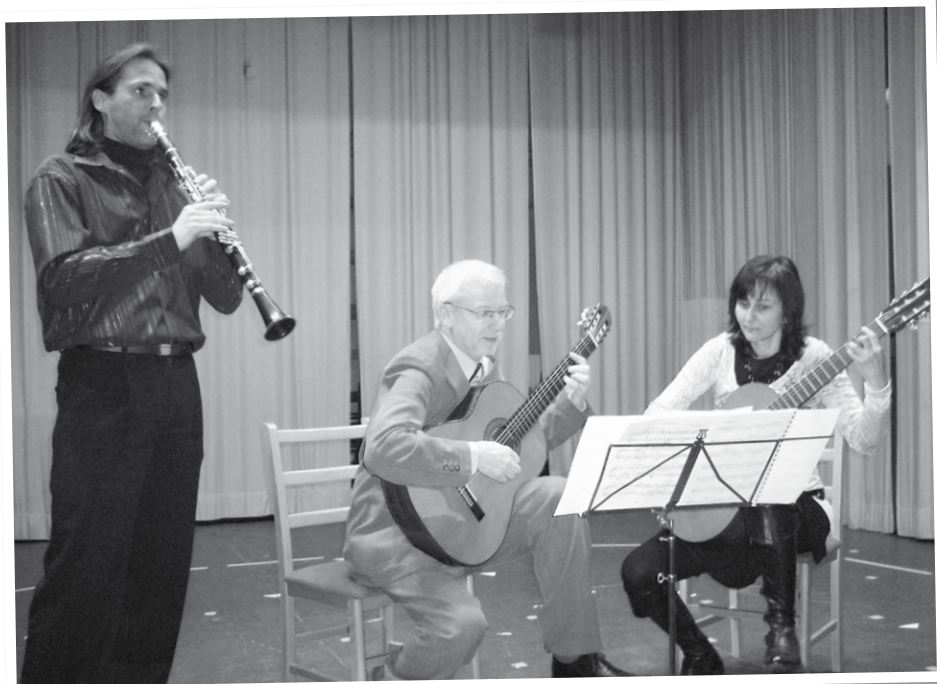
Učitel'ský koncert 21. 3. 2013 v sále Dělnického domu