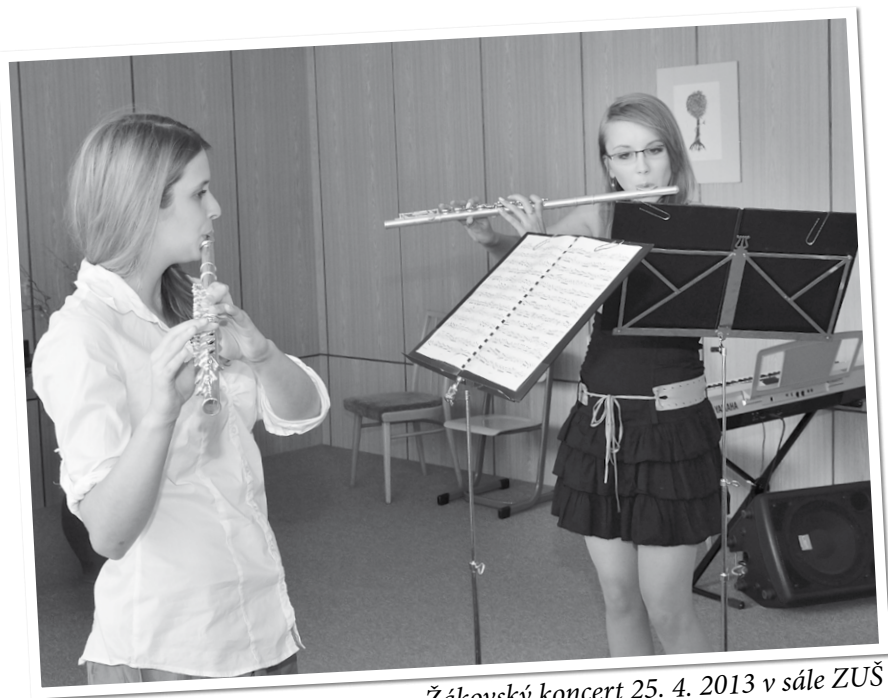
Žákovský koncert 25. 4. 2013 v sále ZUŠ