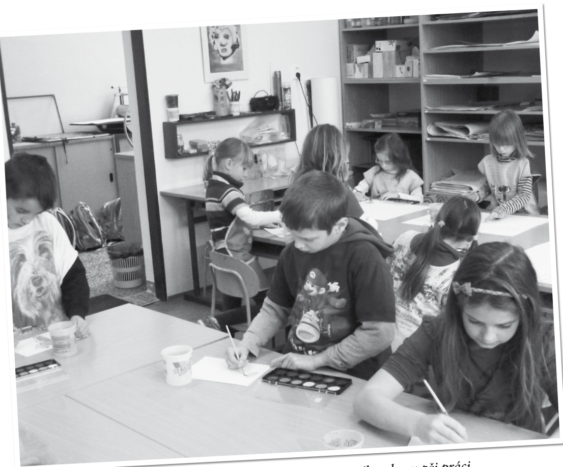
Žáci výtvarného oboru při práci