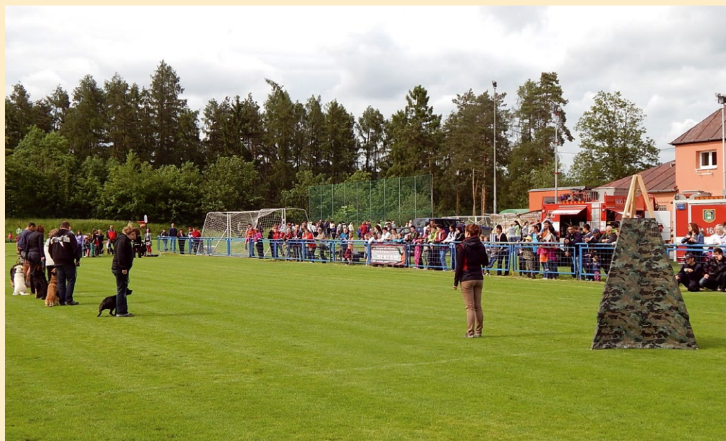
Den dětí v Zastávce