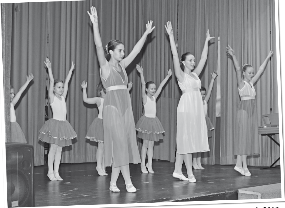
Vystoupení zákyň tanečního oboru na vánočním koncertě 13. 12. 2012