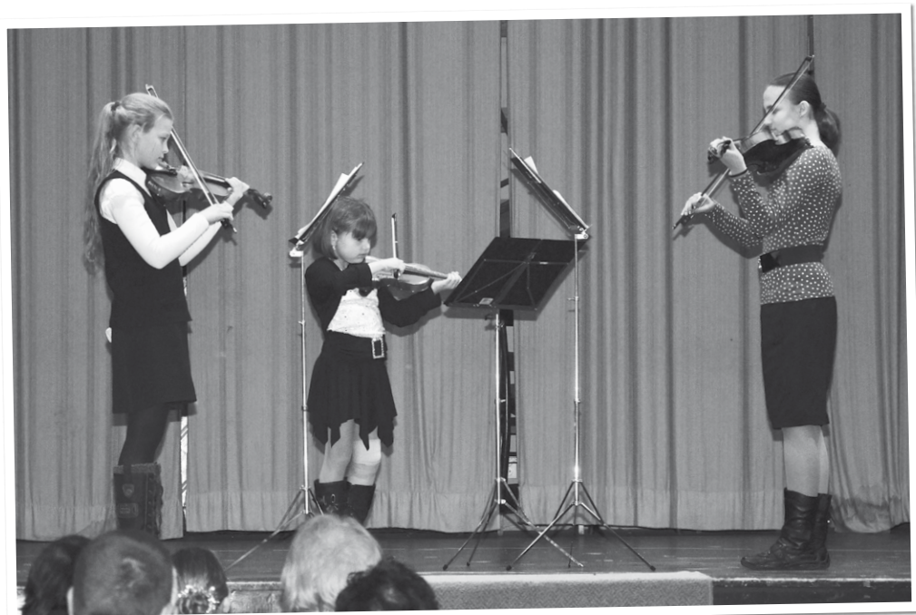
Houslové trio na vánočním koncertě 13. 12. 2012