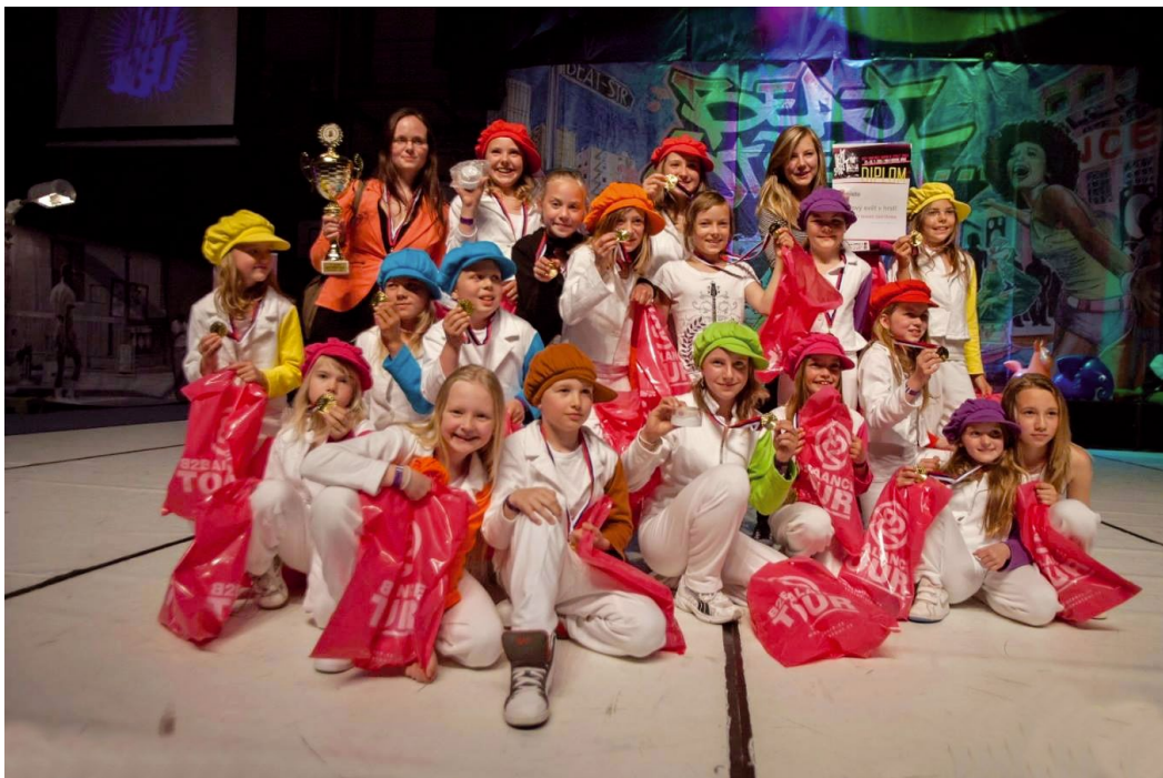
Děti Mighty Shake Zastávka – 1. místo na mistrovství ČR