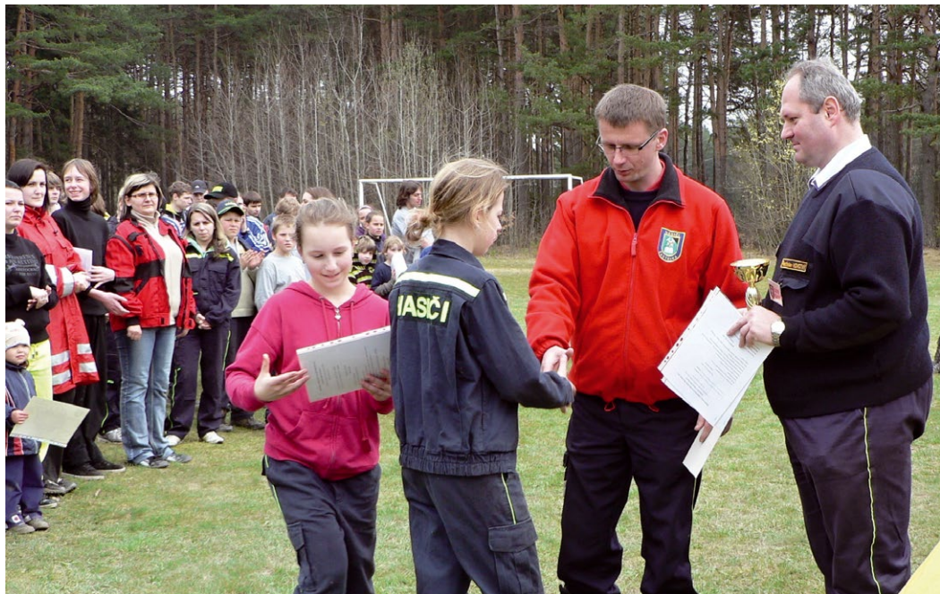
Hasiči zahájili novou sezónu